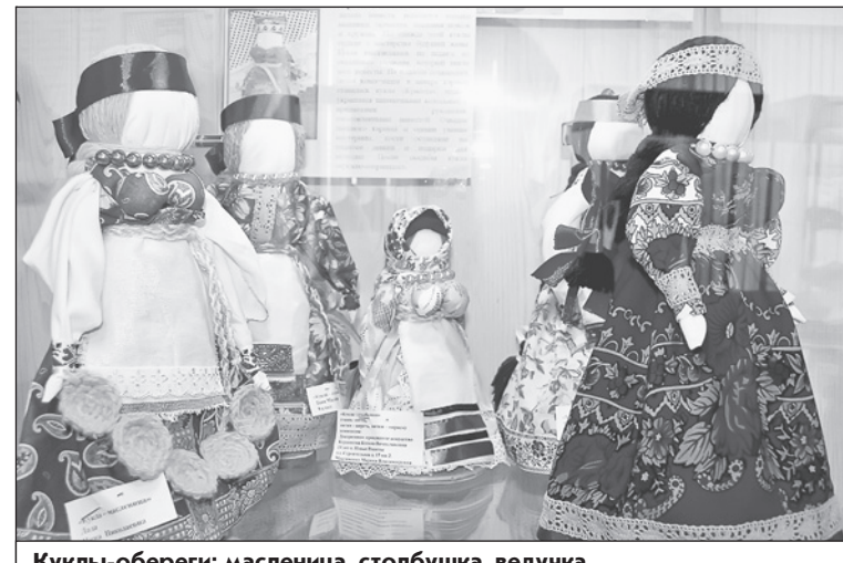
Куклы-обереги: масленица, столбушка, ведучка

На выставке можно увидеть разнообразных кукол: здесь есть и куклы-столбушки, и куклы-ведучки, и масленица-маслена, и другие.