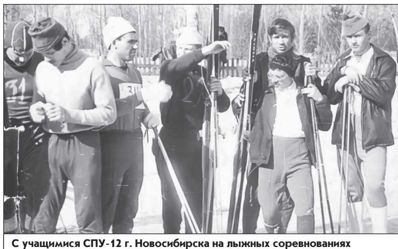
С участниками СПУ-12 г. Новосибирска на лыжных соревнованиях